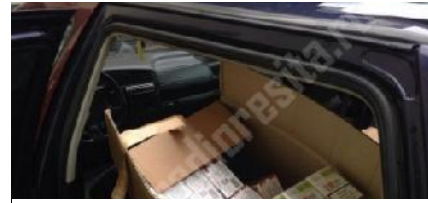
Contrabandă cu repetiție la Lugoj