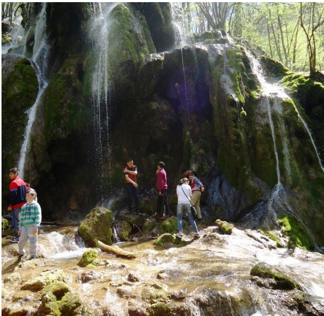
Cascada Beu ni ei. Legenda spune ca apa cascadei este de fapt voalul de mireasa pe care frumoasa ciobanica din Banat nu a mai apucat sa-l poarte.